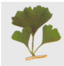
FOTO: Ginko biloba

Raritou v našich zemepisných šírkach je exemplár stromu ginko biloba (vetvička a listy na obrázku vľavo). Jedná sa o prastarý druh zaraďujúci sa medzi ihličnaté rastliny, ktorého listy sa na jeseň sfarbia do sýtožltá a opadnú. Na Zemi rastie od druhohôr, teda asi 200 miliónov rokov. Vedci boli dlho presvedčení o tom, že pred miliónmi rokov vyhynul, no v 17. storočí našli v čínskej provincii Če-Ťjang celé háje ginkových stromov. V súčasnosti sa na celom svete používa ako okrasný strom, pretože veľmi dobre znáša znečistenie a nevyskytujú sa na ňom takmer nijakí škodcovia. Zároveň je zdrojom cenných prírodných látok, ktoré sa používajú v liekoch podporujúcich dobrú telesnú i duševnú kondíciu. Prežil všetky klimatické zmeny a kataklizmy, ktoré neprežili mnohé zvieratá a rastliny, napríklad aj výbuch atómovej bomby v Hirošime a Nagasaki. Dožíva sa úctyhodného veku 1 200 až 2 000 rokov. Na Slovensku existuje asi 140 jedincov.